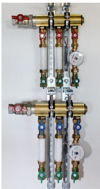
GE530Y102 à 106 GE530Y202 à 206